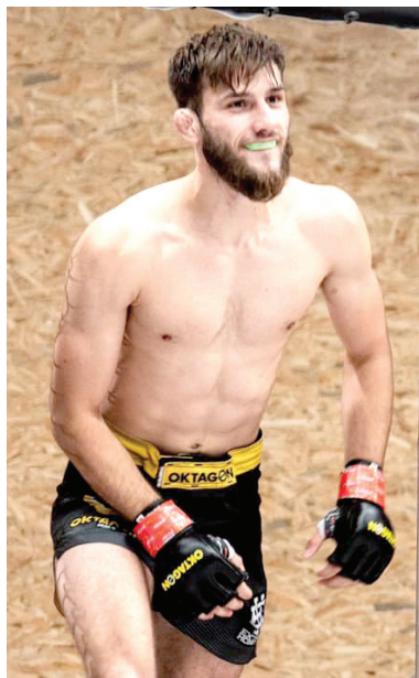
Tomáš Zajac