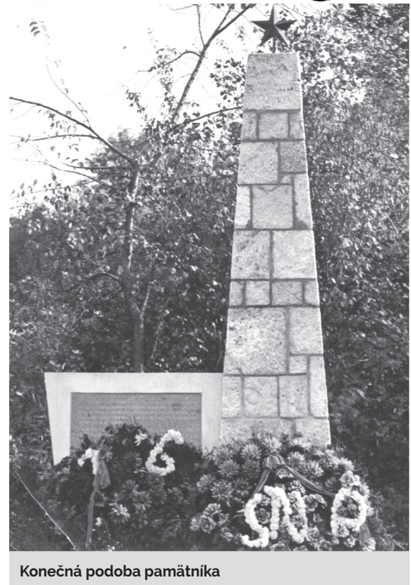
Konečná podoba pamätníka

napriek snahám obyvateľov uchrániť svoje životy pred represáliami zo strany okupujúcich jednotiek sa to nie vždy podarilo. Vyhladzovacie jednotky plienili, pálili a vraždili. Hrôzy vojny neobišli ani vtedajšie Baťovany. Po potlačení povstalcov sa v obci usídlila jednotka Gestapa, ktorá mala za úlohu nájsť, vypočuť a následne zlikvidovať partizánov. Miesto likvidácie mnohých neznámych hrdinov z radov partizánov a civilného obyvateľstva sa nachádzalo v miestach vyschnutého ramena rieky Nitry (priestor dnešných záhradiek pri rieke). Svoju smrť tu našlo dovedna 35 osôb.