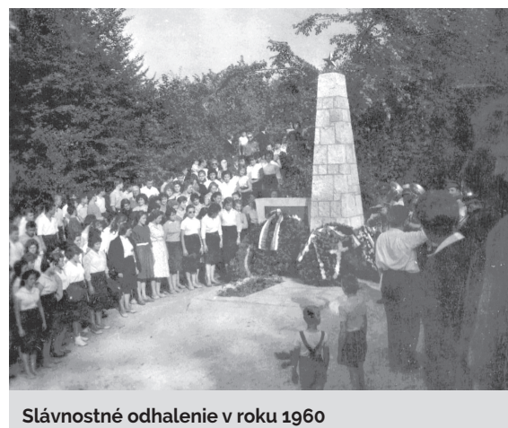
Slávnostné odhalenie v roku 1960