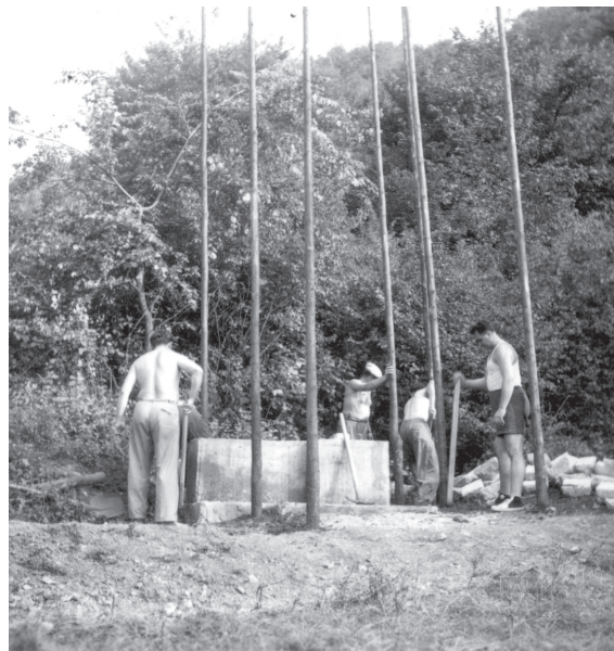
Dobrovoľníci pri výstavbe dolného pomníka

Po potlačení Slovenského národného povstania nemeckým okupačným silám záležalo na tom, aby zlikvidovali všetky jestvujúce odbojové skupiny, ktoré prešli na partizánsky spôsob života a boja do hôr. Zlikvidovať tieto skupiny odporu sa fašistom, i napriek ich veľkej snahe, nepodarilo. Partizánske jednotky mali oproti tým fašistickým jednu veľkú výhodu – podporu slovenského obyvateľstva. Aj