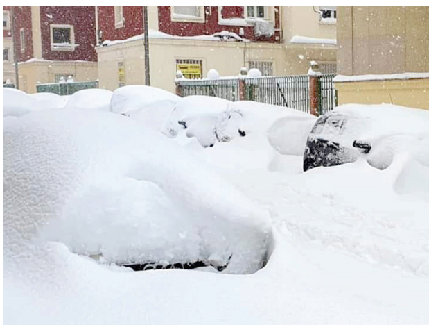
Najväčšia snehová nádielka od roku 1950. Madrid 9. januára 2021