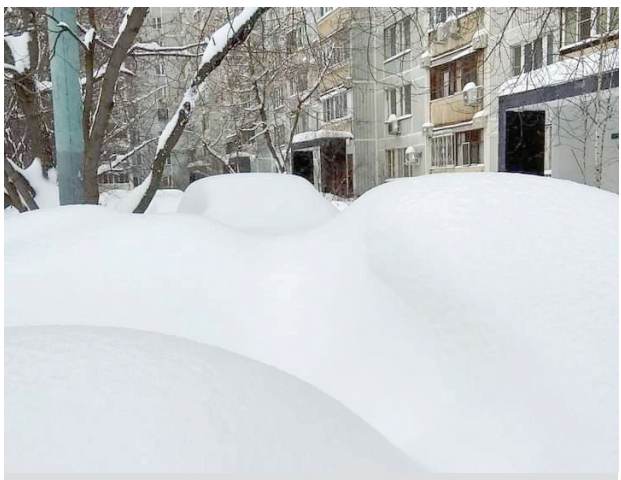
Súťaž „Nájdí svoje auto“, Moskva 13. februára 2021