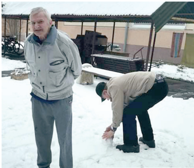
Klienti z Centra sociálnych služieb v Partizánskom sa tešia vonkajším i vnútorným aktivitám

Centrum sociálnych služieb funguje odvtedy za prísnejších bezpečnostných a hygienických podmienok. „Na zamestnancov a zamestnankyne aj klientov a klientky sú kladené zvýšené nároky. Prebieha i edukácia všetkých o opatreniach a potrebe ich dodržiavania, pretože v zariadení sa nachádzajú aj s takými diagnózami, ako sú Alzheimer, skleróza multiplex či Parkinson. Mnohí z nich nechápu zložitú opatrení a obmedzení, ktoré sme museli prijať a nevedia sa stotožniť so zložitou situáciou, ktorú pandémia priniesla,“