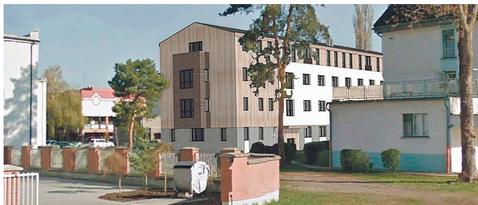
Nový vzhľad i charakter budova nadobudla v roku 2015

v septembri sa realizovali vodovodné, kanalizačné prípojky a vymurovali sa všetky priečky. Následne na to sa začali v interiéri bytovky robiť omietky a potery. Súčasťou rekonštrukcie bolo aj vybudovanie spevnených plôch zo zámkovej dlažby. Počas decembra už stavbári pracovali na vonkajšej fasáde a vo vnútorných priestoroch sa dorábali omietky. „Postupne budeme maľovať časti bytov a budú sa zhotovovať sadrokartónové stropy. Týmto pádom by sa mali všetky práce uzatvárať,“ zhrnul stavbyve-