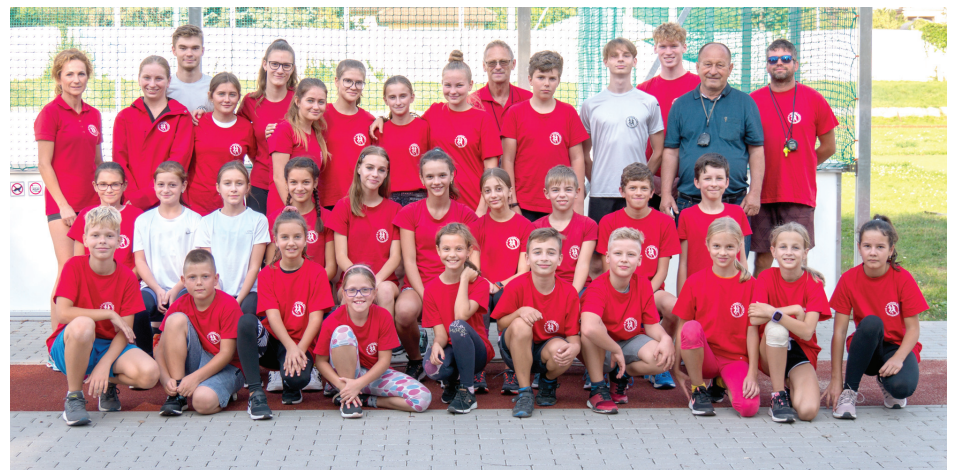
Členovia Atletického oddielu Partizánskeho