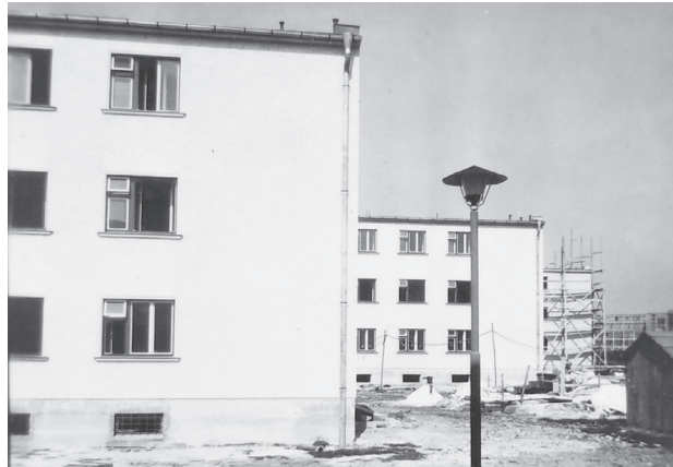
Pohľad na slobodáreň č. 8 (vzadu)

Postavená bola na začiatku 50. rokov minulého storočia, pričom celkové náklady na jej výstavbu predstavovali viac ako 1 350 000 korún. V roku 1992 bola budova sprivatizovaná a po zmene vlastníka sa uvažovalo, že v nej budú sídliť kancelárie. V deväťdesiatych rokoch však bola slobodáreň č. 8 neslávne známa neporiadkom nielen v okolí, ale aj vo vnútri ubytovne. Jej nájomníkmi boli zväčša občania rómskej národnosti a tieto priestory sa často stávali nocľahárňou aj pre rôzne kriminálne živly.