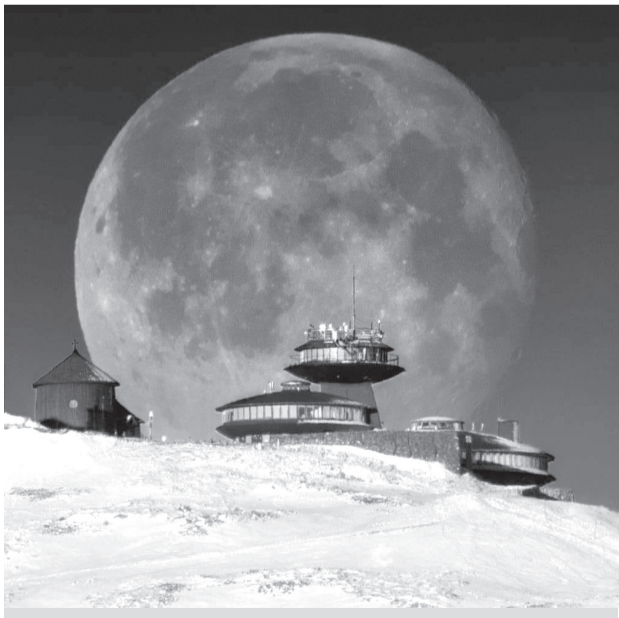
Zaujímavá mesačná perspektíva na poľskej strane Snežky 1. marca 2021