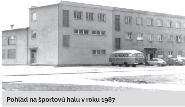
Pohľad na športovú halu v roku 1987

Samospráva dala v súvislosti so zámerom rekonštrukcie mestskej športovej haly vypracovať projektovú dokumentáciu, ktorá bude obsahovať návrh technického riešenia, pozostávajúci z búracích prác a nových konštrukcií. Rekonštrukčné práce budú spočívať najmä v demontáži pôvodnej plechovej strešnej krytiny a položení novej. Renovácia bude zahŕňať tiež výmenu okien, dverí a zateplenie objektu. Ako je uvedené