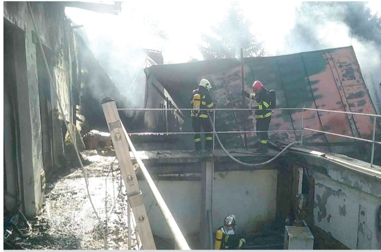
Požiar opustenej budovy v Bánovciach 23. februára

Vo februári uskutočnili príslušníci Hasičského a záchranného zboru v Trenčianskom kraji celkom 201 výjazdov.