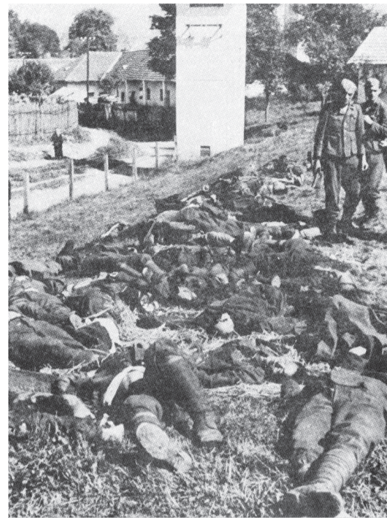
Telá partizánov v Malých Uherciach

hodinách bola skupina 46 partizánov na ústupe z vrchu Šípok do obce Malé Uherce, v čom ich prekvapila jednotka nemeckých SS-ákov, ktorí ich na mieste zmasakrovali. Po tomto čine sa rýchlo stratili v horách. Po následnom ústupe partizánov k Oslanom boli telá zmasakrovaných obetí zhromaždené pri hlavnej ceste, kde boli odfotografované a neskôr využité ako „výstraha“ všetkým partizánom a ich rodinám. Telá boli neskôr pochované v hromadnom hrobe a v roku 1957 boli exhumované a uložené na cintoríne v Topoľčanoch.