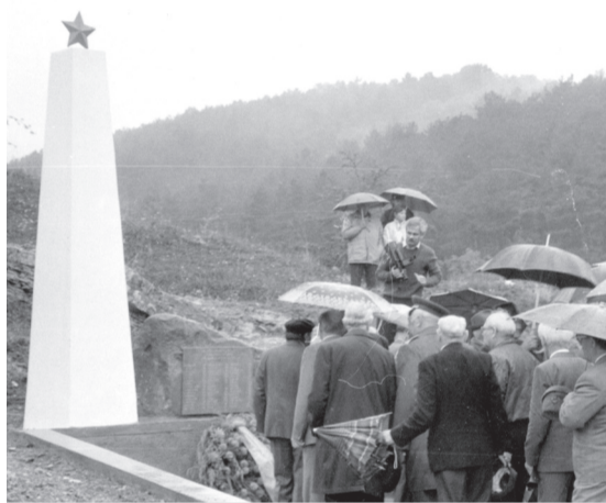
Pamätník v deň odhalenia

V posledný augustový deň roku 1989 bol neďaleko od miesta tohto masakru odhalený pomník, ktorý pripomína najvyššiu obeť baťovianskych partizánov. Pamätník pozostával z betónového pylónu, na vrchu ktorého bola umiestnená červená hviezda a z kameňa, na ktorom bola osadená pamätná doska s me-