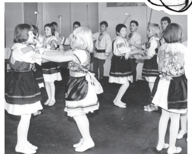
Vystúpenie pionierov 2. ZDŠ na Obuvníckej ulici v roku 1972 pri príležitosti MDŽ

im k ich sviatku. Nezabúdalo sa ani na našich starších, ktorí svoju jeseň života trávil v domove dôchodcov, i pre nich si pionieri pripravili kultúrny program a vyrobili im milé pozdravy. Pravdou je, že vládnuce režim mal byť svojimi pracovníckam a ženám za čo vďačný. Zástupkyne nežného pohlavia tvorili základ národného hospodárstva a svojou usilovnou prácou prispievali k splneniu a prekročovaniu vtedajších výrobných plánov. I ženy pracujúce v národnom podniku v Partizánskom zaznamenali nemalé úspechy, mnohé z nich sa už v prvých rokoch hospodárskeho plánu podieľali na podávaní zlepšovacích návrhov a vynálezov, ba niektoré sa zapísali i do fondu päťročnic, kedy priniesli alebo ušetrili „milióny pre komunizmus“. Ženy taktiež tvorili gro pracovníkov vtedajších podnikov. Napríklad v národnom podniku ZDA pracovalo v roku 1985 až 16 044 pracovníkov, z čoho až 9 320 boli ženy.