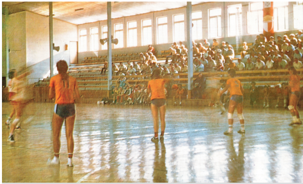
Športovisko je úzko späté s konaním zápasov v hádzanej

v návrhu, ktorý bol predložený na prerokovanie, povinnou prílohou žiadosti o poskytnutie finančného príspevku je okrem iných dokumentov aj uznesenie mestského zastupiteľstva o tom, že schvaľuje predloženie uvedenej žiadosti, zabezpečenie realizácie projektu a spolufinancovanie projektu z rozpočtu mesta. To predstavuje 50 % z celkových