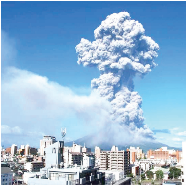
Obлак pyrocumululus po výbuchu sopky Sakurajima v Japonsku 7. marca 2021