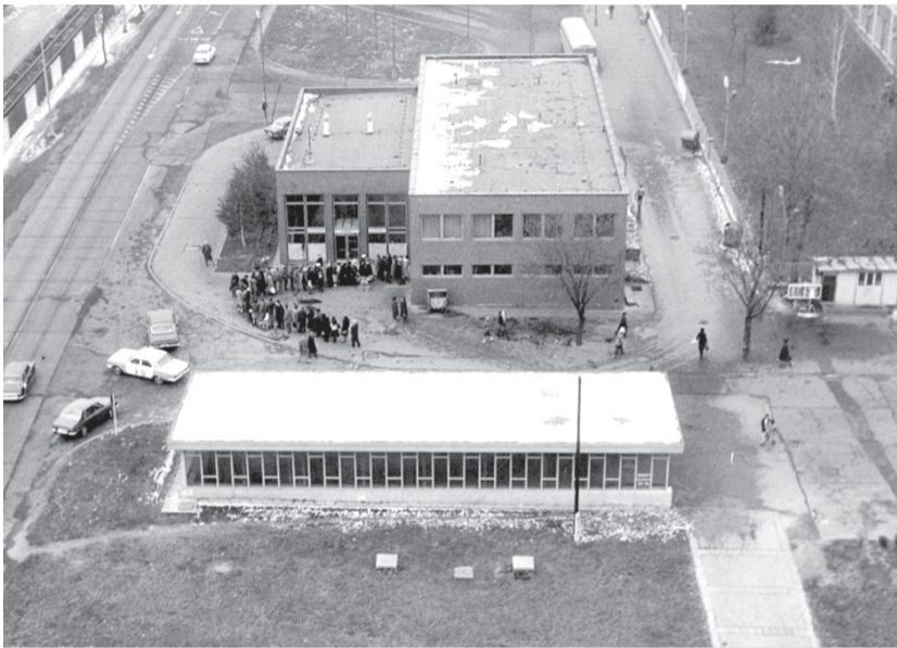
Pôvodná autobusová stanica vznikla v 70. rokoch minulého storočia

stavebné povolenie, pričom sa začalo s odstraňovaním pôvodnej stavby, teda prvých nástupišť, a so zavedením elektrickej energie. V lete sa dokončili obe podlažia v rámci hrubej stavby a od-