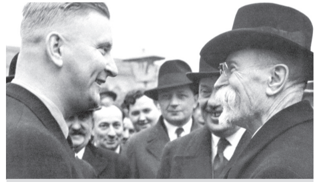
Narodeniny 7. marca oslavoval nielen Jan Antonín Baťa, ale aj Tomáš Garrigue Masaryk