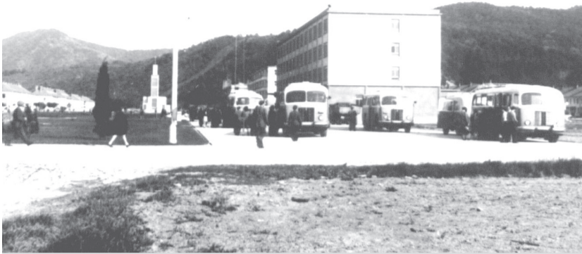
Prvé nástupištia vybudovali v centre mesta