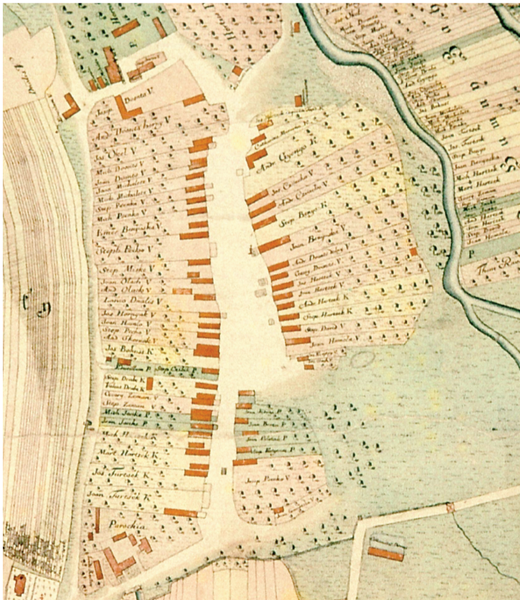
Intravilán obce na mape z roku 1807