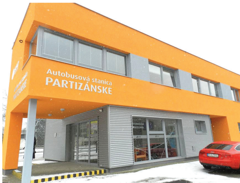
Modernú budovu dokončili na prelome rokov 2014 a 2015

Katarína Jankeje, (ms)