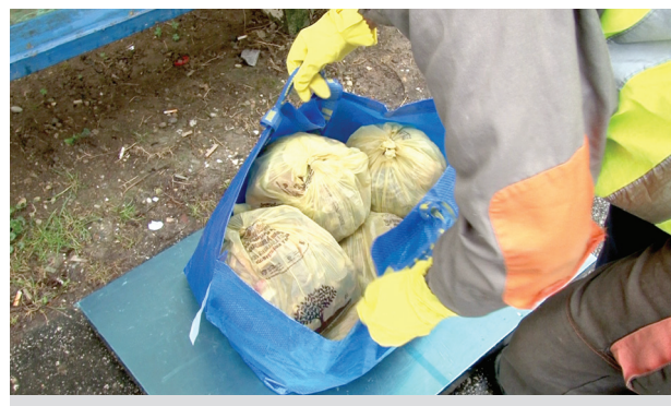
Odpadky sa z každého vchodu vážia