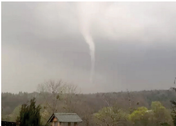
Z tejto tromby vzniklo prvé tohtoročné tornádo na Slovensku, v obci Ploské v okrese Košice-okolie, 22. apríla 2021