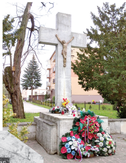
Pomník obetiam 1. svetovej vojny

Pamätník padlým v Slovenskom národnom povstaní sa nachádza pred miestnou rezidenciou