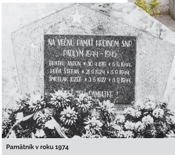
Pamätník v roku 1974

Tatrabanka. Pomník pozostáva z kamennej platne, na ktorej je umiestnená pamätná doska s menami troch padlých obyvateľov obce, ktorí svoje životy položili počas SNP. V okolí pamätníka sa nachádzajú lavičky a žrde na vlajky.