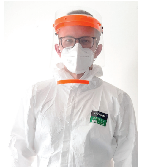
naháňala vojaka po vestibule nemocnice,“ dodáva so smiechom mladý medik. Od začiatku pandémie v nemocnici pomáhali celkovo traja medici.

jímavých ľudí, našiel si nových priateľov, naučil sa lepšie komunikovať s pacientmi a pracovať pod tlakom,“ vypočítava všetky pozitíva negatívnej epidémie. Veľa ho naučili najmä rôznorodí pacienti. „Niektorí boli naozaj milí, občas aj zábavní, iní zas naopak veľmi nepríjemní. V pamäti mi utkvela spomienka na jednu staršiu pani, ktorá vo vestibule nemocnice čakala na sanitku. Vojak, ktorý tam vtedy so mnou pracoval, jej išiel kúpiť čaj, pretože bolo dosť chladno a ona čakala už dlhšie. Pani toto gesto dojalo a rozhodla sa vojakovi dať za ten čaj 5 eur, ten ich, samozrejme, v žiadnom prípade nechcel prijať. Akurát, že aj pani bola v tomto veľmi neoblomná, a tak vznikla situácia, pri ktorej staršia pani v ruke s bankovkou