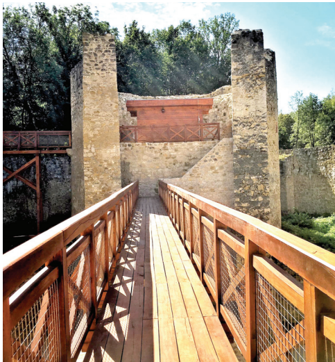
Vstup na Trenčiansky hrad je možný aj cez južné opevnenie

Múzeá, hrady, zámky či ďalšie kultúrne inštitúcie na území Trenčianskeho kraja sú opäť dostupné pre širokú verejnosť. Návštevníci však musia počítať s určitými obmedzeniami a hygienickými opatreniami.