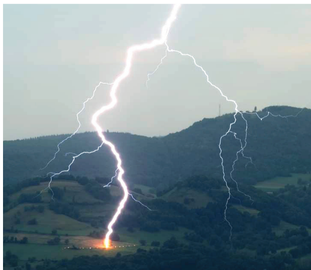
Ukážkový zásah blesku do stromu. Savojské Alpy 2017