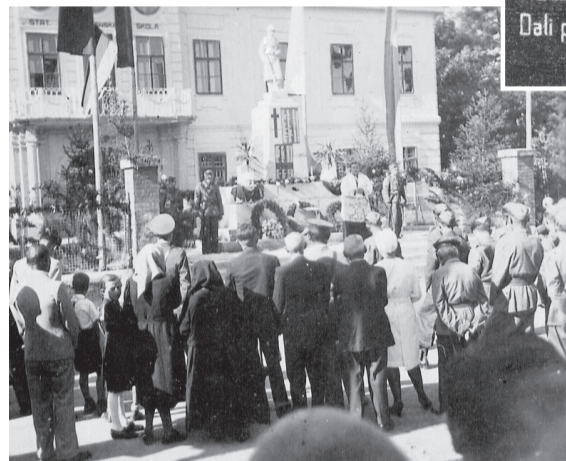
Pomník v deň odhalenia v roku 1927

V roku 1948 bola z iniciatívy zamestnancov vtedajšieho podniku Baťa v Bošanoch odhalená pamätná tabuľa pred bránou koželuzní, na ktorej