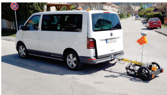
Vozidlom so špeciálnym vybavením zdiagnovali aj podložie cesty na Moyzesovej ulici