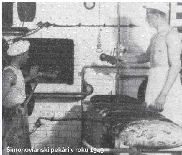
Šimonoviánski pekári v roku 1949