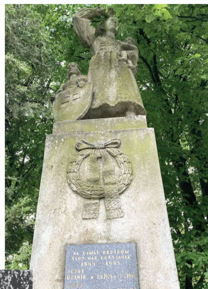
Pamätník obetiam 1. svetovej vojny – súčasná podoba

Písal sa 28. október 1938, kedy bol v obci, neďaleko od miestneho kaštieľa, odhalený pamätník, ktorý okoloidúcim pripomína pamiatku padlých v 1. svetovej vojne. Pamätník pozostáva z vysokého pylónu, na vrchole ktorého je umiestnená pieskocová socha ženy v klátovskom kroji a zvierajúce dieťa v náručí hľadí do diaľky. Pri tejto podobizni sa nachádza vyobrazenie dieťaťa, ktoré drží slovenský znak. Pod sochou bol umiestnený nápis „Vráti sa?... Jej nádej sa nesplnila, ale splnila sa nádej národa“. Pôvodne boli na bokoch pylónu pamätníka umiestnené dve pamätne dosky s menoslovom obyvateľov, ktorí zahynuli v bojoch 1. svetovej vojny. V roku 1952 bola na priečelí pomníka osadená mramorová doska s menami padlých