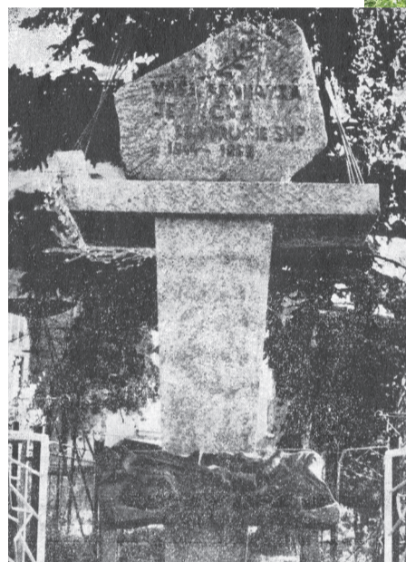
Pomník obetiam 2. svetovej vojny