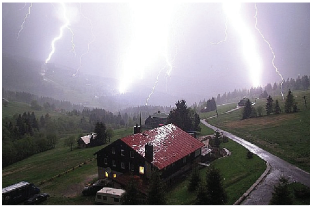
Rozvetvený blesk pri nočnej búrke v Peci pod Sněžkou 20. mája 2011

Búrka je súbor zložitých fyzikálnych javov, výsledkom ktorého je elektrická aktivita, ktorá produkuje blesky a hromy. A ako vzniká taký blesk? Na začiatku sú výrazné výstupné pohyby vzduchu. Pri slnečnom počasí sa vzduch, hlavne v lete, výrazne prehrieva, čím sa stáva ľahším a stúpa nahor, kde sa postupne ochladzuje. Ak má v sebe aj viac vlhkosti, v určitej výške začne vodná para kondenzovať (skvapalňovať sa) a tvorí sa kopovitý oblak. V prípade, že sú výstupné prúdy veľmi výrazné, dokážu vyniesť vodnú paru až do hladiny s teplotou pod 0 °C. Tam sa z kvapiek pary tvoria ľadové kryštáliky, často prerastajúce až do ľadovca. Vzniká oblak s názvom Cumulonimbus (daždňová kopa). V búrkovom mraku dochádza k neustálej vertikálnej cirkulácii vodných kvapiek a kryštálikov, vzniká medzi nimi trenie, čo vedie k tvorbe elektrického náboja. Kladný náboj sa zhromažďuje v jednej časti oblaku, záporný v tej opačnej. Takto vznikajú obrovské rozdiely potenciálov medzi mrakmi alebo aj me-