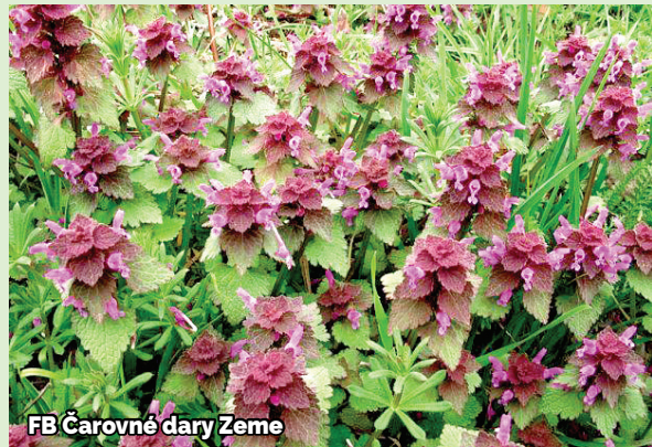
FB Čarovné dary Zeme

Hluchavka purpurová , ľudovo hluchá žihľava, hojne rastie v záhradách, na okrajoch múrov, na poliach a horských lúkach. Mnohí ju považujú za burinu. Na niektorých miestach vytvára rozsiahle koberce. Dorastá do výšky 15-20 centimetrov a kým nekvitne, skutočne sa podobá na prhľavu. Doba kvitnutia je od marca do septembra. Malé kvety majú purpurovú alebo ružovo-