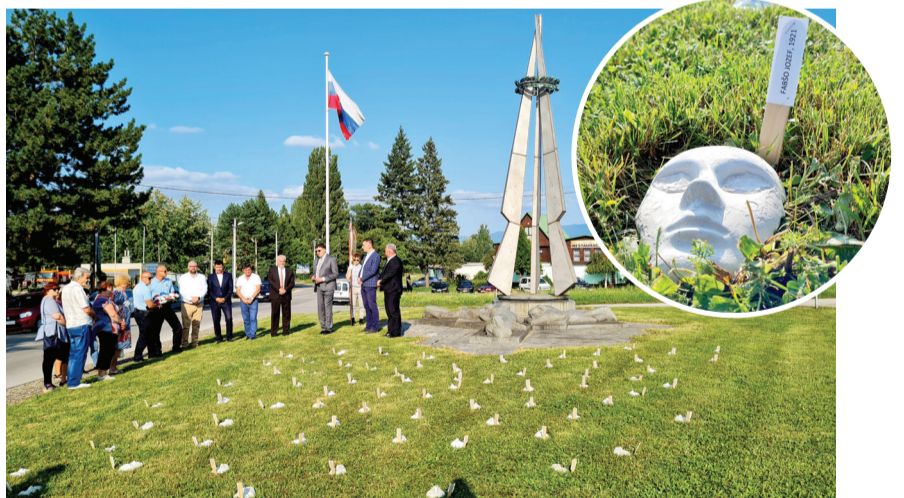
Spoločne s odliatkami tváří sú pri Pamätníku vyzbrojovania v Šimonovanoch aj mená všetkých padlých a unikátne farebné fotografie z vyzbrojovania partizánov v osudné augustové dni. Pamätník budú skrášľovať po dobu jedného mesiaca