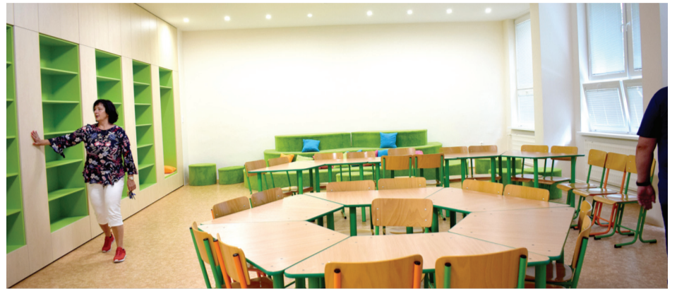
Knižnica bude slúžiť žiakom ZŠ na Malinovského ulici i na rôzne prednášky a podujatia

Samospráva zakúpila 41 nových okien, ktoré nahradia pôvodné na budove Cirkevnej základnej školy s MŠ Jána Krstiteľa. Okrem toho sa vymenili aj zadné vchodové dvere do objektu. „Budova bude mať už úplne iný vzhľad, ale hlavne sme vďační za to, že ušetríme dosť veľa peňazí na vykurovanie, teda na energiách, lebo tie okná boli v zlom stave a nešli už