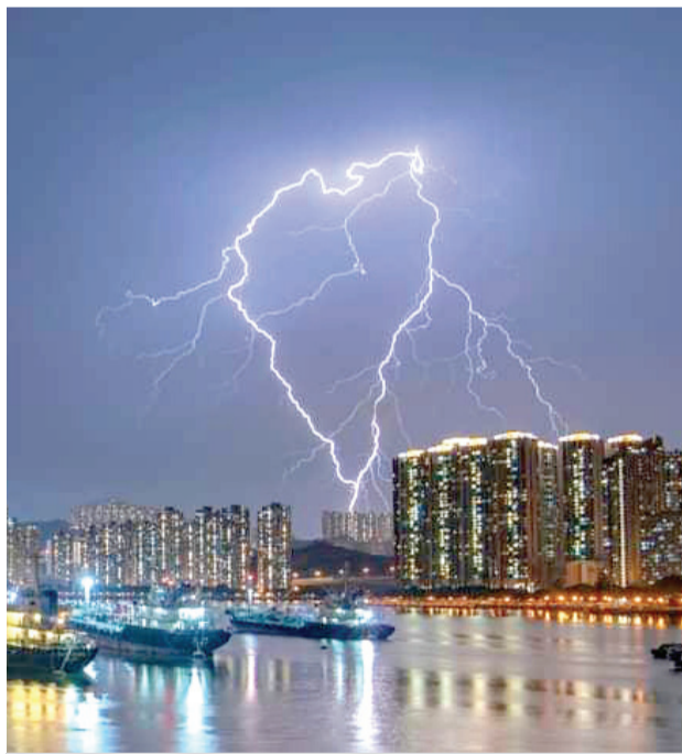
„Srdečný“ úder blesku v Hong Kongu 2021

Dopady globálnej klimatickej zmeny na teploty sú výrazné a nesporné. Jasne o nich vypovedajú štatistické záznamy. Asi najvýraznejšie sa to za posledných 30 rokov prejavilo na počte dní s teplotou nad 30 °C, teda tých tropických. Kým do roku 1990 sme v Partizánskom mali v priemere za rok približne 12 až 13 tropických dní, aktuálny priemer už narástol na takmer 26. Jasným dôkazom klimatickej zmeny sú aj priemerné mesačné teploty. Od roku 2014 sme v Partizánskom prepísali rekordne najvyššie priemery až deviatich mesiacov v roku. Odolali iba mesiace august, september a október. Ako sa však prejavilo globálne otepľovanie na zrážkach? Celkovo nám v Partizánskom narástol ročný zrážkový priemer o 13 mm. Je to výsledok toho, že v atmosfére sa vďaka stúpajúcim teplotám oceánov dokáže