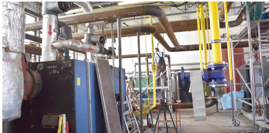
Na modernizácii tepelných rozvodov sídliska Luhy II sa pracuje od októbra minulého roka

Novú komunikáciu pre peších vybudovali Technické služby mesta na Púpavovej ulici smerom od základnej školy na sídlisku