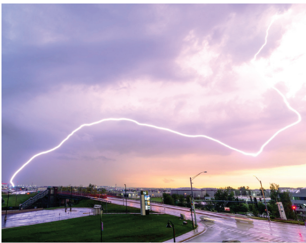
Čiarový blesk nad Chicagom, 27. august 2021

Po chladnom závere leta sa nám v prvej septembrovej dekáde počasie stabilizovalo a nastúpilo obdobie mariánskeho (neskorého) leta. Mohla za to rozsiahla oblasť vysokého tlaku, ktorá sa usadila nad veľkou časťou Európy. Po jej zadnej strane prúdil najmä do západnej Európy veľmi teplý vzduch. Vo Francúzsku namerali až 37 °C a napríklad v Británii boli lokality, kde mali teplejšie ako v celom tohtoročnom lete. Slovensko sa nachádzalo skôr v strede, či na prednom okraji spomínaného vysokého tlaku, a neprúdil k nám až taký horúci vzduch. Slnčné lúče však ešte stále majú dostatočnú silu, aby vyhnali teploty v tomto čase na letnú úroveň. Prúdiaci vzduch však bol zároveň aj dostatočne suchý a mali sme veľké rozdiely medzi dňom a nocou. Nakoľko noci sú už neporovnateľne dlhšie ako na začiatku či v strede leta, v najchladnejších lokalitách sa už teploty môžu dostať do rána aj pod bod mrazu. Prvý mráz tejto jesene v lokalitách s nadmor-