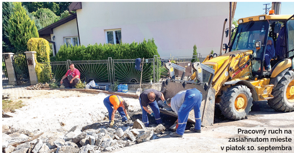
Pracovníci na zasiahnutom mieste v piatok 10. septembra

O pár hodín nato zasiahnutú časť potrubia vypílili a keďže poškodenie bolo natoľko rozsiahle, diely na opravu bolo nutné doviezť až z Piešťan. „Oceňujem pohotovú zásahu zo strany vodárov a promptné riešenie. Situáciu sa im poradilo dostať pod kontrolu ešte vo večerných hodinách, kedy bolo potrubie opravené a následne spustili prívod vody,“