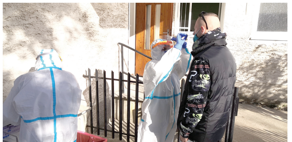
Nemocnica v Partizánskom aj naďalej prevádzkuje MOM, v ktorom sa dá otestovať antigénovým aj PCR testom