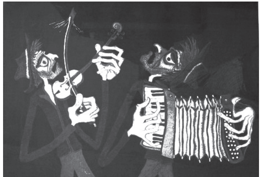
Z cyklu autorových uhľokresieb s názvom Desatoro

Rok 1975 sa niesol v znamení návratu do školských služieb, ale iba na čiastočný pracovný úväzok. Popri výtvarnej činnosti sa začal venovať aj písaniu. Reagoval na necitlivé združstevňovanie drobných roľníkov, v ktorých pretrvávali desaťročiami zakorenené návyky spôsobu obrábania pôdy. Snažil sa zachovať zdravé a kvalitné životné prostredie. Poukazoval na zasahovanie doň a tiež nedostatočné čistenie odpadových vôd veľkých závodov na hornej Nitre, v dôsledku ktorých sa