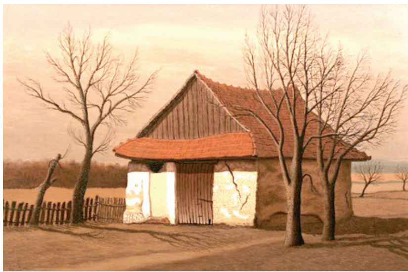
Prišiel na konkrétne miesto a dokázal ho dokonale stvárniť. Jeho tvorba je plná obrazov, na ktorých sú znázornené pajty a bežní ľudia