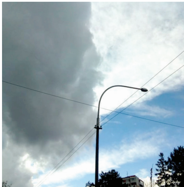
Príchod prehánky v Partizánskom 4. novembra 2021