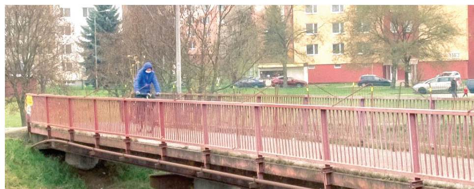
Firmu, ktorá opraví lávku pre peších, musia vyberať nanovo