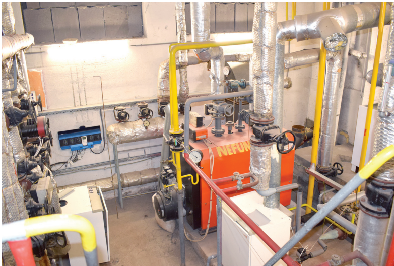
Práce v MŠ na Obuvníckej ulici zahŕňali dodanie a montáž plynového kotla