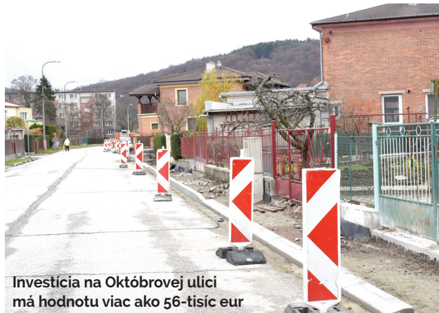
Investícia na Októbrovej ulici má hodnotu viac ako 56-tisíc eur