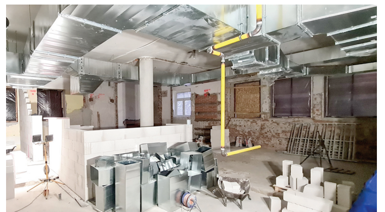
Do zmodernizovanej kuchyne pribudnú aj nové spotrebiče či odsávanie